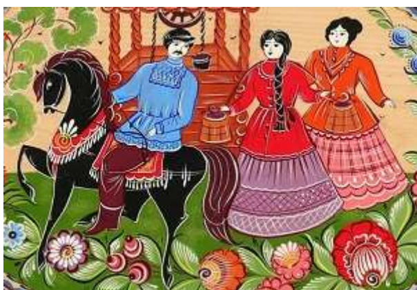
Всадник символизирует жениха в городецкой росписи

Это может быть роспись в два или три яруса, традиционная для промысла. В верхней части в таком случае пишется основной сюжет (застолье или гулянья, например), в нижней же сюжеты, которые позволяют теме раскрыться. Средняя часть обычно представлена цветочной полосой. Если же доски имеют не совсем вытянутую форму, художник может обойтись и без нижнего яруса: он изображает только главную сюжетную сцену, которая опоясана цветочной полосой.