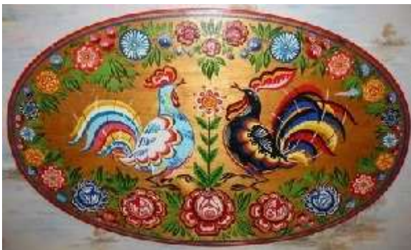
Петушок — символ добрых вестей

Как только новые мотивы (то есть животные) появились в городецкой росписи, увеличилось число вариантов композиций. Наряду с симметричными мотивами появляются и ассиметричные. Или же, к примеру, в симметричном цветочном узоре возникают две ассиметричные по рисунку птицы (они даже могут различаться по цвету).